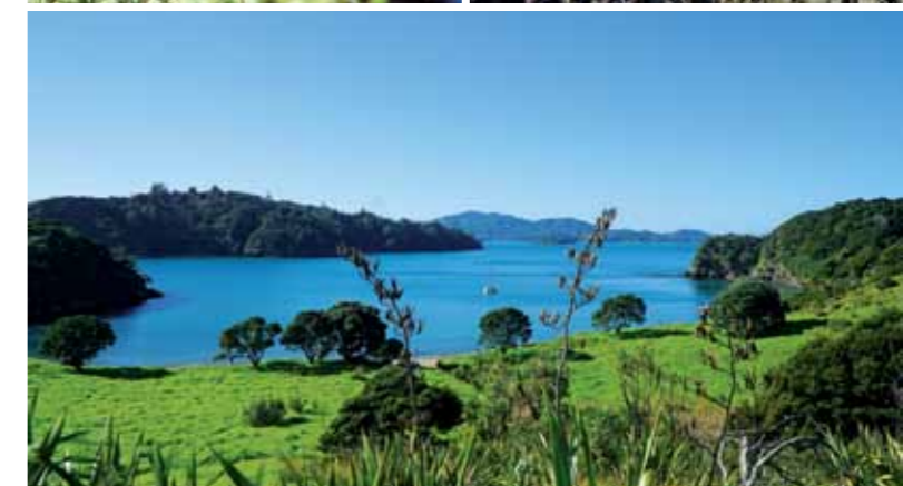
Die Maori betrachten sich als „Menschen des Landes“ und fühlen sich mit der Umwelt untrennbar verbunden.